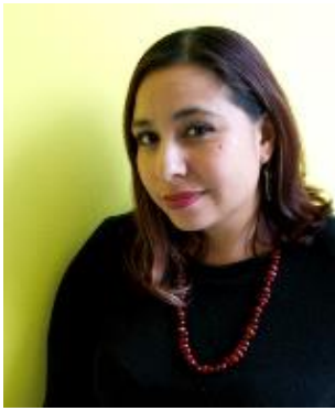
Mtra. Tamara Medina Rubio Comisión Nacional de Derechos Humanos